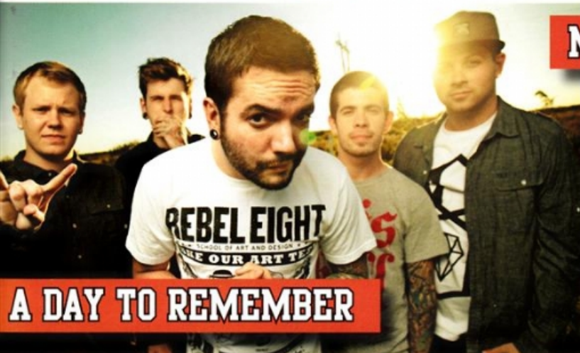
A DAY TO REMEMBER